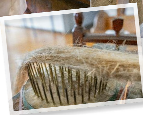
Das Leben der Leinenweber zeigt sich eindrucksvoll im Weberei- und Heimatmuseum – unter der Stube wurde in einem Kellerraum, der Dunk, am Webstuhl gearbeitet und aus dem Flachs (l.) entstanden Leinenstoffe

Die Frau des Webers hält mit dem Kind Ausschau nach ihrem Mann – heute bildet er den Leinenweberbrunnen (r.)