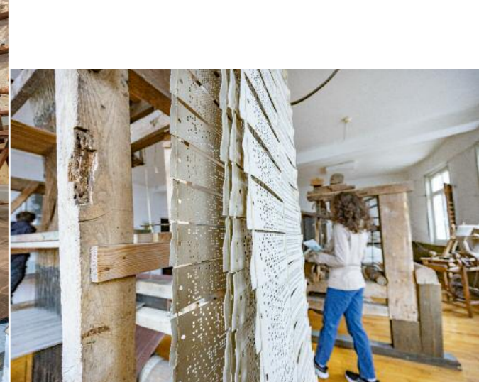
Als die Webstühle moderner wurden, sorgten Lochkarten für ganz vielseitige Stoffmuster