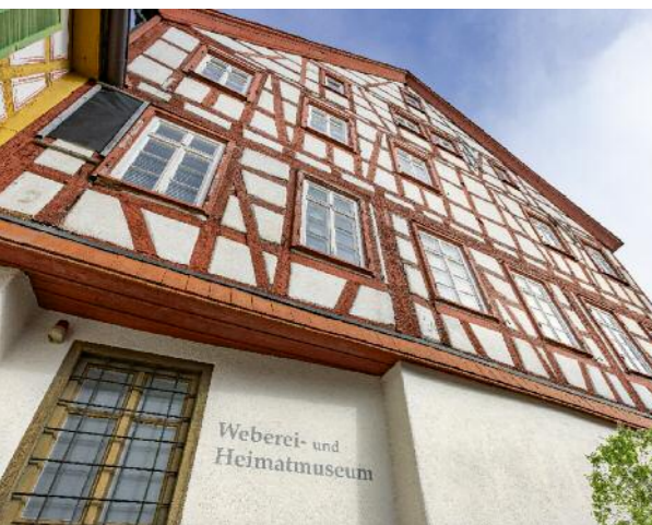
Inmitten des Ortskerns – einen Besuch im Weberei- und Heimatmuseum sollte man auf keinen Fall verpassen